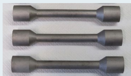
Abbildung 4: Zirkoncarbid-Heizelemente für Hochtemperaturprozesse.