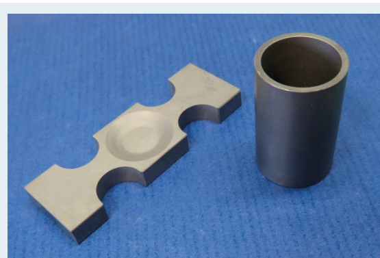
Abbildung 1: Verdampfer- und Tiegelmaterial aus Zirkoncarbid.

Vor diesem Hintergrund wurde ein Verfahren entwickelt, mit dem dichte ZrC-Werkstoffe in unterschiedlichen Geometrien über eine drucklose Sinterung kostengünstig produziert werden können. Die abgestimmte Kombination der technologischen Schritte ermöglicht die Herstellung großformatiger ZrC-Komponenten mit einer Länge von mehr als 250 mm. Ebenso lassen sich Platten und Stäbe erzeugen. Solche Bauteile können als elektrische Heizleiter, thermischer Schutz, Fluidleitungen oder Konstruktionselemente für Hochtemperaturanwendungen eingesetzt werden und damit die Betriebsqualität für Hochtemperaturanlagen verbessern.