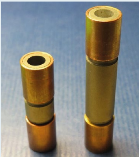
Abbildung 3: Kupferringe als Endkontakte zu Zirkoncarbid-Testkörpern, Schumpftechnik auf metallisierter Oberfläche.

Mit Hilfe innovativer Füge Technologien lassen sich Zirkoncarbid-Heizelemente zuverlässig in das Gesamtsystem einbinden. Bereits getestete Legierungen auf der Basis von Fe-Si-Ti ermöglichen Temperaturen an der Fügezone von > 1200\text{ °C} . Die jeweilige Funktion der ZrC-Komponenten definiert die Anforderungen an die Anbindung: elektrische Ankopplung, thermische Isolation oder Leitung für Anlagenkomponenten sowie mechanische Verstärkungen, Träger oder Abgrenzungen.