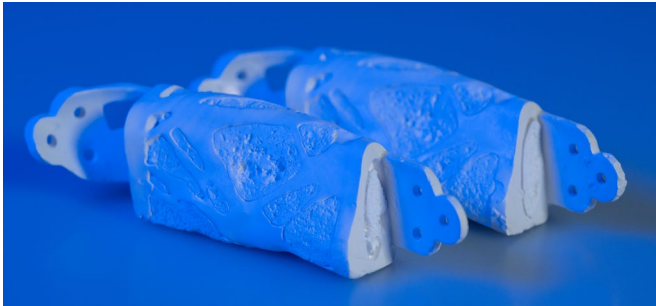
Figure 1: Human artificial jawbone demonstrator.

Bone defects in the craniofacial region are often associated with esthetic and functional impairments. Until now, autologous bone grafts, e.g. from the fibula or the pelvic bone, have been used for reconstruction. However, these offer only an inadequate reproduction of the complex anatomy of the facial skull.